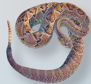
Cascabel Crotalus durissus

Muchas especies de serpientes -que contribuyen naturalmente al control de plagas- están en riesgo. Por eso, se recomienda no matarlas a menos representen un peligro inminente. Simplemente, alejarse, no molestarlas y dejarlas seguir su camino.