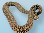
Yarará Grande Bothrops alternatus

Concurrir con urgencia a un centro médico