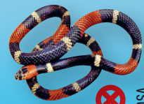
Coral Micrurus pyrrhocryptus