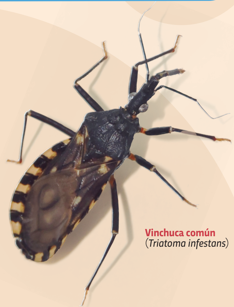
Vinchuca común ( Triatoma infestans )

Programa Provincial de Chagas - Dirección de Epidemiología - Ministerio de Salud de Córdoba