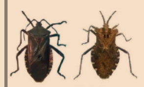
Pachylis sp. Coreus sp.

PICO RECTO Y FINO Dividido en cuatro segmentos y más largo que la cabeza.