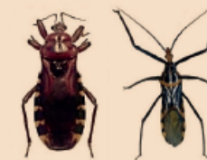
Brontostoma sp. Zelus sp.

PICO CURVO Y ANCHO CON PUNTA FINA Dividido en tres segmentos y del mismo largo que la cabeza.