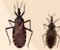
Triatoma infestans Triatoma quasayana

PICO RECTO Y ANCHO Dividido en tres segmentos y del mismo largo que la cabeza.